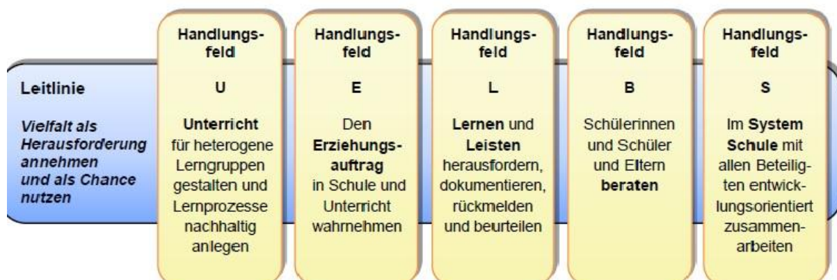
Abbildung 1: Handlungsfelder unter der Leitlinie Vielfalt (vgl. Kerncurriculum für die Ausbildung im Vorbereitungsdienst für Lehrämter in den Zentren für schulpraktische Lehrerausbildung und in den Ausbildungsschulen, Ministerium für Schule und Weiterbildung des Landes Nordrhein-Westfalen, abgerufen am 4.9.23)

In diesen Handlungsfeldern erwerben die LAA professionelle Handlungskompetenzen, die die Grundlage für die Ausbildung an der Schule und damit für die zweite Staatsprüfung darstellen. Alle Handlungsfelder stehen untereinander in einer engen wechselseitigen Beziehung.